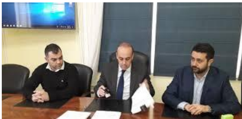
Μελέτη branding για την πόλη της Πάφου